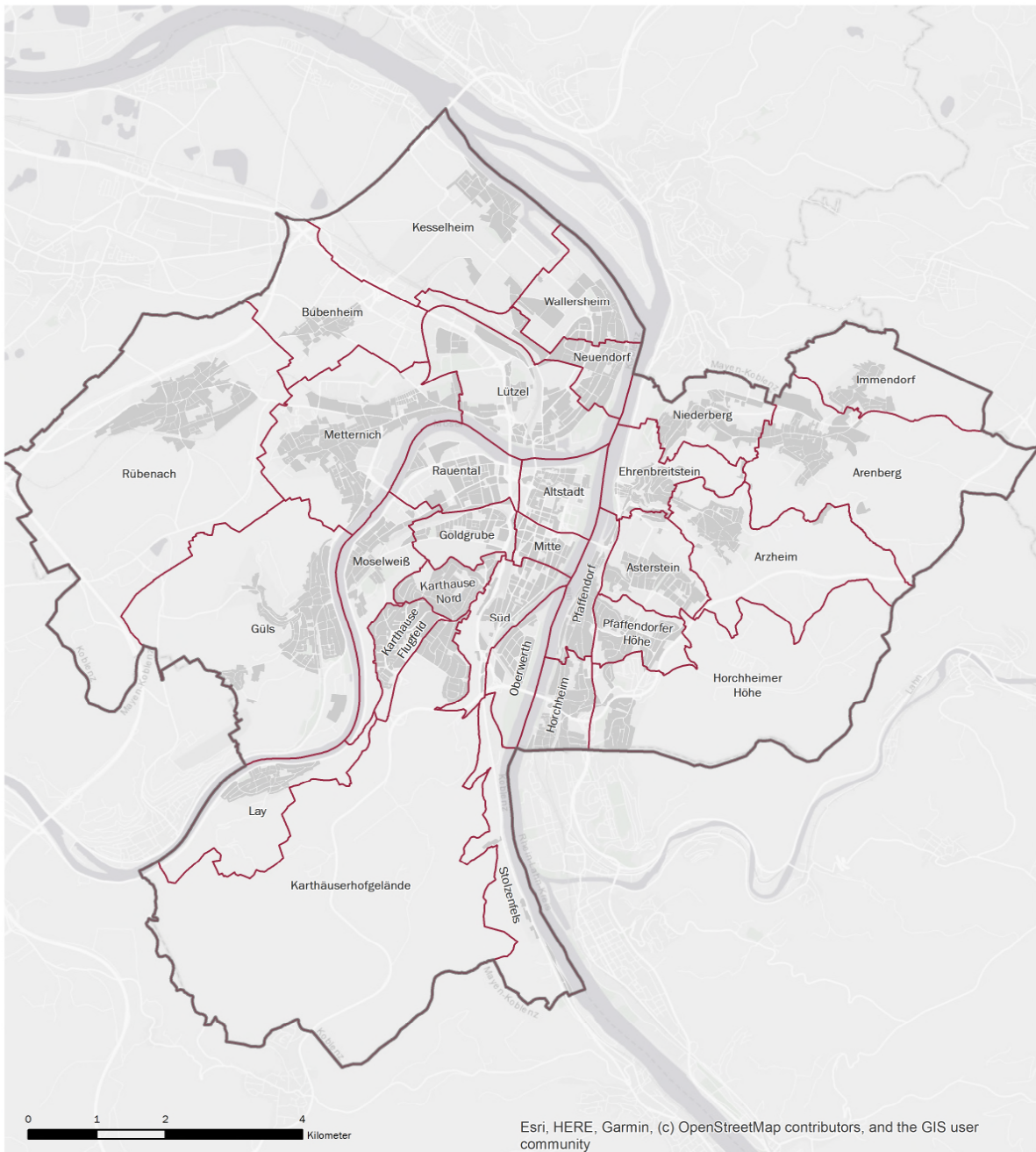
Abb. 0.03 Übersichtskarte der Koblenzer Stadtteile