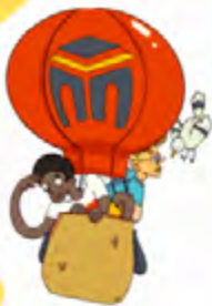
Illustration : Anny Pignatelli Schmeisser