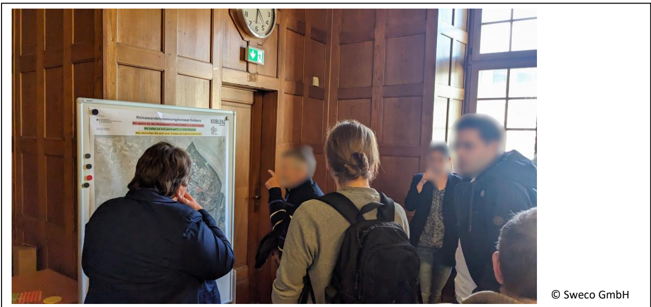
Abbildung 12: Diskussion an Station 3