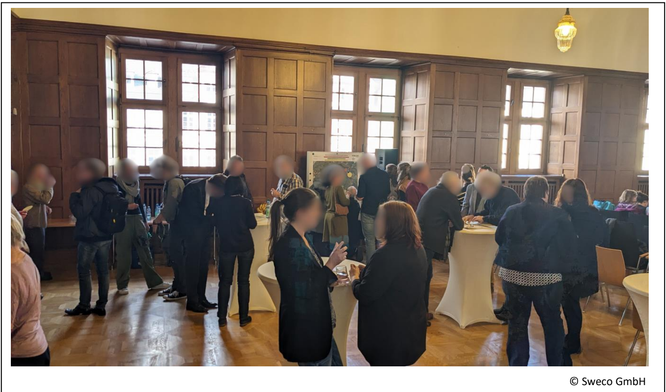
Abbildung 9: Austausch und Vernetzung I