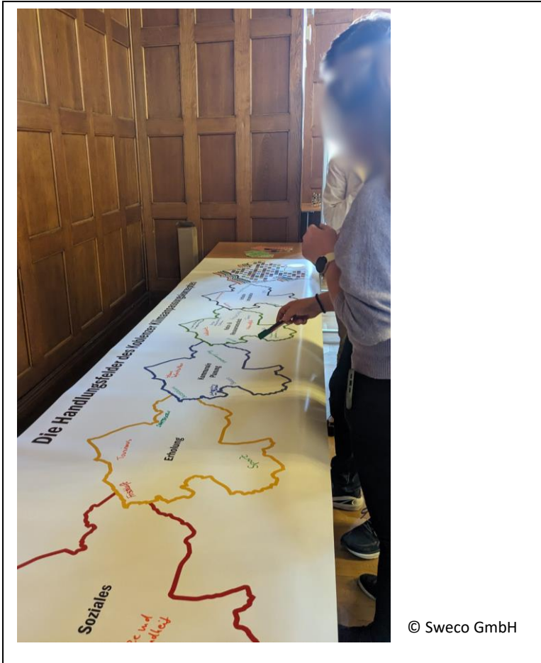
Abbildung 11: Bearbeitung der Station 1